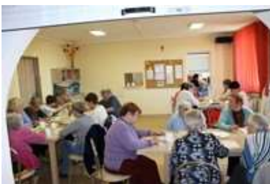
Gra w Bingo