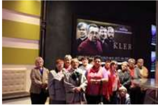
Wyjazd do kina IMAX