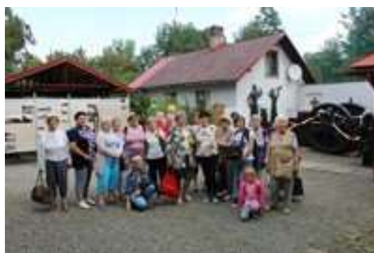
Zwiedzanie Ustronia i Koniakowa