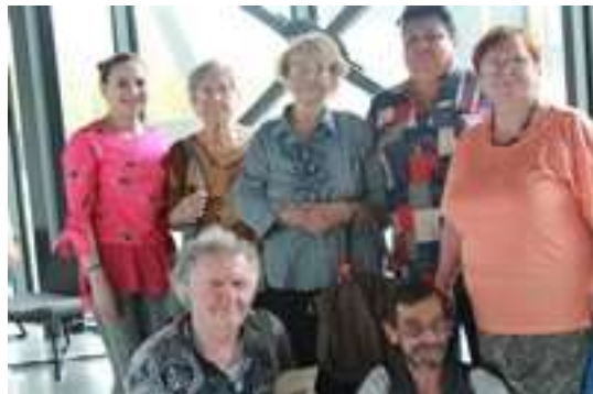
Spotkanie integracyjne z seniorami miasta Wieże KWK Polska