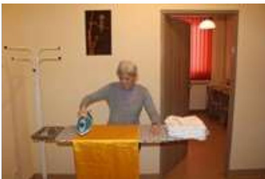
Korzystanie przez uczestników z automatu pralniczego i deski do prasowania