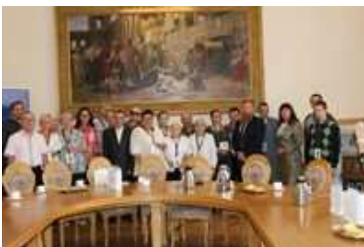
I Świętochłowicki Sejmik do spraw osób niepełnosprawnych