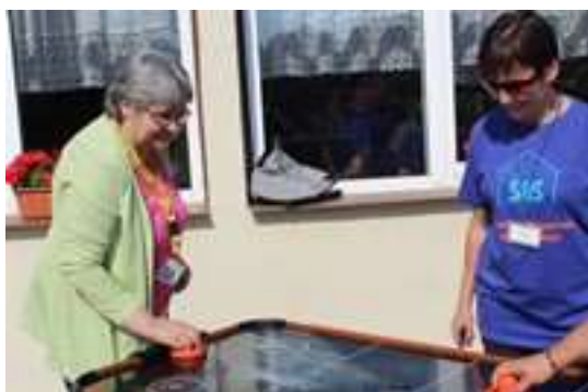
III Mistrzostwa Cymbergaj