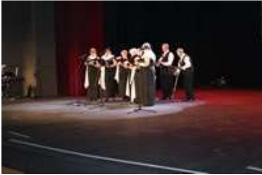
Występ Chóru „Senior+” w Przeglądzie Artystycznym w Dąbrowie Górniczej