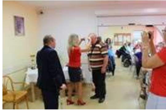
VIII Turniej w „Rummikub”

Realizacja projektu przyczyniła się do przeciwdziałania marginalizacji seniorów w sferze społecznej, wpłynęła na kreowanie pozytywnego wizerunku osoby starszej, przełamała stereotypy dotyczące starości, funkcjonujące nie tylko wśród młodszego pokolenia, lecz również wśród starszych seniorów. Realizacja zadania przyczyniła się do aktywizacji społecznej oraz poprawy kondycji psychofizycznej osób w wieku starszym zamieszkałym na terenie miasta Świętochłowice. Projekt również rozszerzył ofertę edukacyjną dla seniorów.