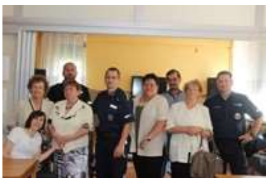
Spotkanie z Policjantem

Realizowane były poprzez np. warsztaty komputerowe, zajęcia plastyczne, treningi pamięci, konkursy konsultacje specjalistów jak np. lekarza, psychologa, dietetyka. Seniorzy brali czynny udział w cyklu wykładów, pogadań, seminariów prowadzonych przez fachowców z omawianej problematyki. Ważnym elementem był udział w spotkaniach organizowanych w zaprzyjaźnionych miejscach, gdzie seniorzy mieli okazję poznać wybraną problematykę oraz świadczone dedykowane usługi przez daną instytucję.