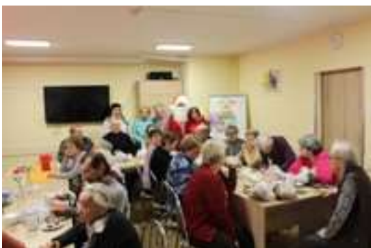
Spotkanie z Mikołajem