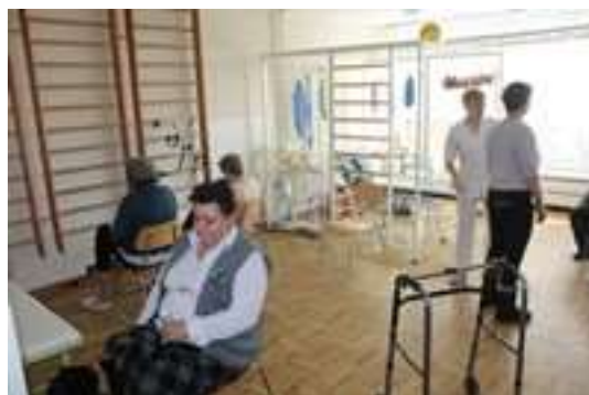
Zajęcia aktywności ruchowej