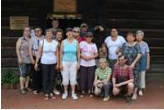
Zwiedzani Skansenu w Chorzowie