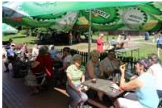
Gry i zabawy z młodzieżą szkolną w Parku Śląskim