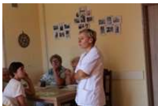
Spotkanie z Fizjoterapeutką