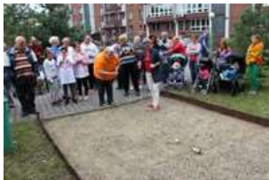
Turniej w Bule