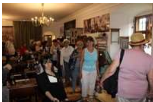
Zwiedzanie Muzeum Cieszyńskiego