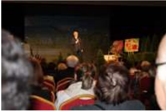
Spotkanie edukacyjne na temat zdrowia