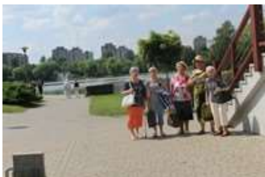
Spacer na Skalce w Świętochłowicach

Podczas realizacji usługi Seniorzy chętnie brali udział w piknikach, festynach wycieczkach, imprezach plenerowych grach zręcznościowych z przyrządami, zabawach na wolnym powietrzu, ćwiczeniach sprawnościowych, spacerach i zajęciach z kijkami do Nordic Walking itp. Ponadto Seniorzy uczestniczyli w turniejach, zawodach konkursach i mistrzostwach.