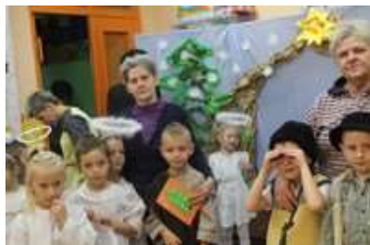
Przedstawienie jasełkowe w wykonaniu przedszkolaków