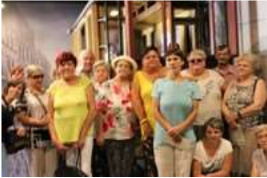
Zwiedzanie Muzeum Powstań Śląskich