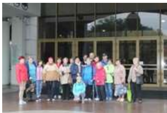
Zwiedzanie Sanktuarium w Łagiewnikach Krakowskich