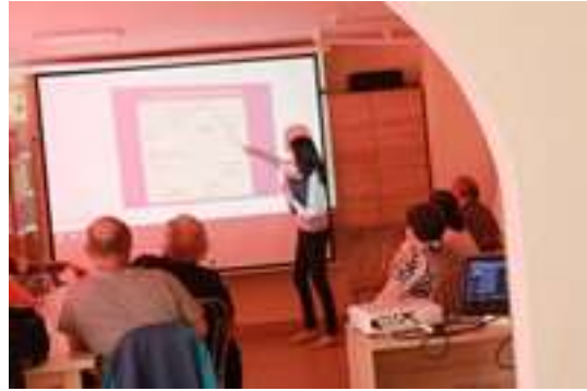
Spotkanie edukacyjne na temat żywienia