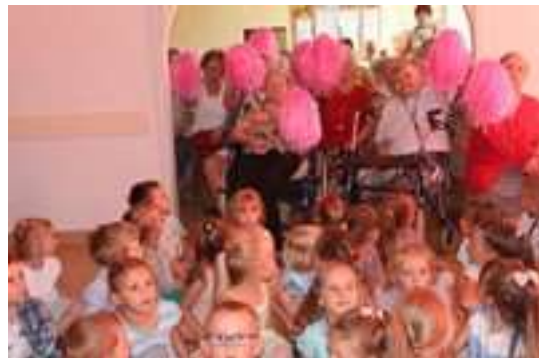
Spotkanie międzypokoleniowe z przedszkolakami