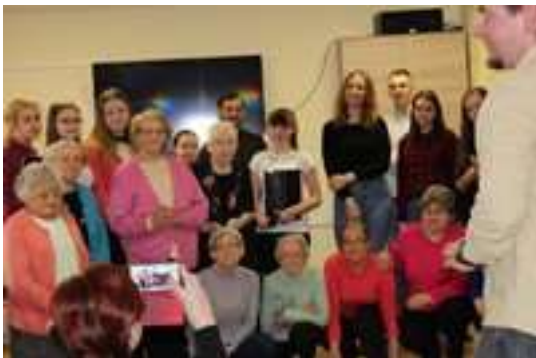
Spotkanie międzypokoleniowe z młodzieżą