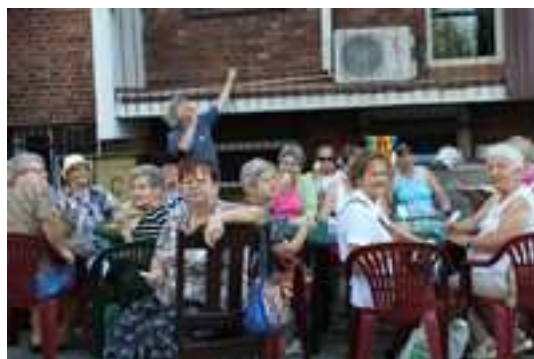
Terapia zajęciowa na wolnym powietrzu