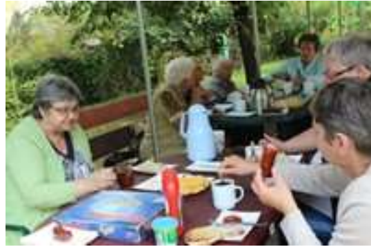
Grillowanie w ogrodzie