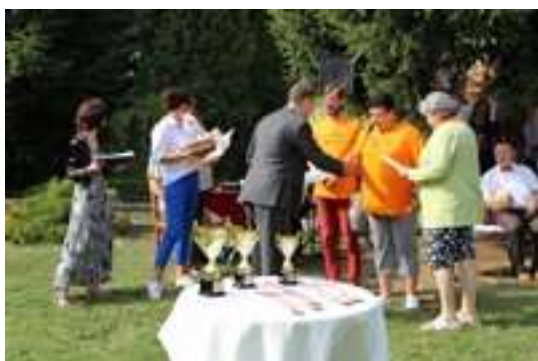
I Turniej w Ringo