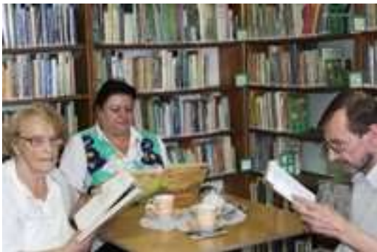
Zajęcia literackie w Miejskiej Bibliotece Publicznej

Realizowane były poprzez zajęcia biblioteczne spotkania z kulturą, międzypokoleniowe z młodzieżą, przedszkolakami, okolicznościowe z okazji „Dnia Babi i Dziadka”, „Dnia Kobiet”, „Dnia Matki”, „Walentynek” itp. Ponadto Seniorzy brali czynny udział w zajęciach literacko-plastycznych w Miejskiej Bibliotece Publicznej w ramach Radosna Jesień Życia oraz chętnie uczestniczyli w wyjściach do kina, teatru, muzeum, zwiedzanie wystaw, wernisaży itp.