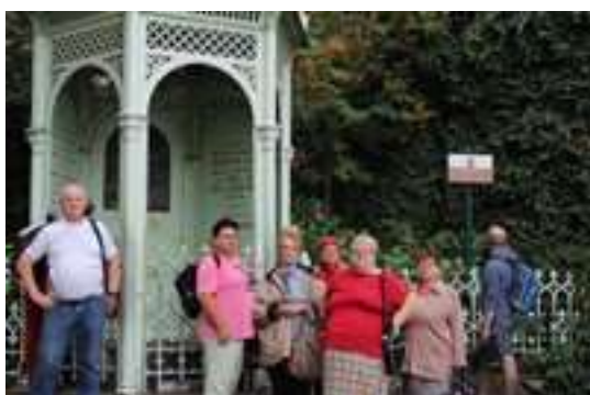
Zwiedzanie Studni Trzech Braci w Cieszynie